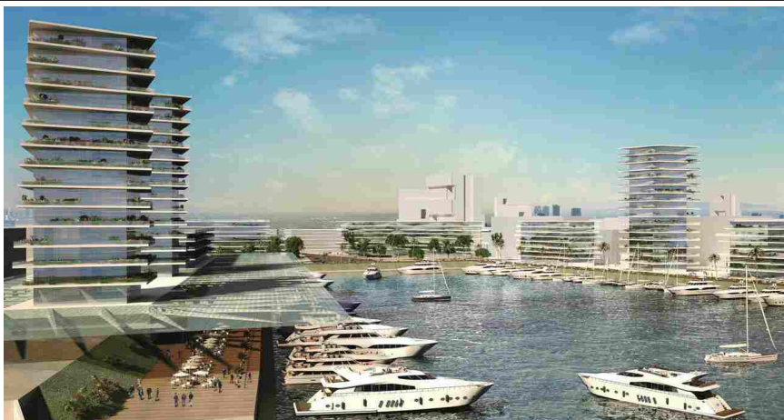
Il progetto di GALA China per la Marina di Jinshan a Shanghai

I due nuovi porti in progetto rispondono a distinte necessità: lo Yacht Club è rivolto ad un pubblico più esclusivo, per ospitare eventi legati alla nautica di lusso, la Marina integra i moli per piccole imbarcazioni con un sistema di portici e piazzette sull'esempio dei porti urbani liguri. Il nuovo waterfront si completa con due centri direzionali. Il primo sfrutta le potenzialità offerte dalla Stazione esistente, attorno alla quale sono stati previsti spazi per servizi congressuali e un'area Eventi con funzioni di supporto. Il secondo, previsto ai margini orientali dell'area, è costituito da un Business Trade and Research Center e da un Parco dell'Aviazione , un campus direzionale rivolto all'industria aeronautica civile.