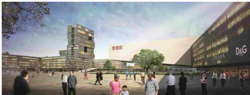
Il progetto di GALA China per la Marina di Jinshan a Shanghai

km che si affaccia su un bacino interno protetto da barriere artificiali; una stazione ferroviaria dalla quale in mezz'ora è possibile raggiungere il centro di Shanghai; alcuni lotti residenziali e terziari e il più antico villaggio di pescatori ancora esistente nella regione di Shanghai. A Est e a Ovest dell'area di progetto sono presenti vaste aree industriali, per le quali si prevedono in futuro ulteriori ampliamenti.