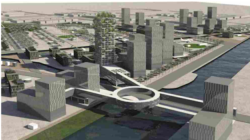
Il progetto di GALA China per la Marina di Jinshan a Shanghai

I due nuovi porti in progetto rispondono a distinte necessità: lo Yacht Club è rivolto ad un pubblico più esclusivo, per ospitare eventi legati alla nautica di lusso, la Marina integra i moli per piccole imbarcazioni con un sistema di portici e piazzette sull'esempio dei porti urbani liguri. Il nuovo waterfront si completa con due centri direzionali. Il primo sfrutta le potenzialità offerte dalla Stazione esistente, attorno alla quale sono stati previsti spazi per servizi congressuali e un'area Eventi con funzioni di supporto. Il secondo, previsto ai margini orientali dell'area, è costituito da un Business Trade and Research Center e da un Parco dell'Aviazione , un campus direzionale rivolto all'industria aeronautica civile.