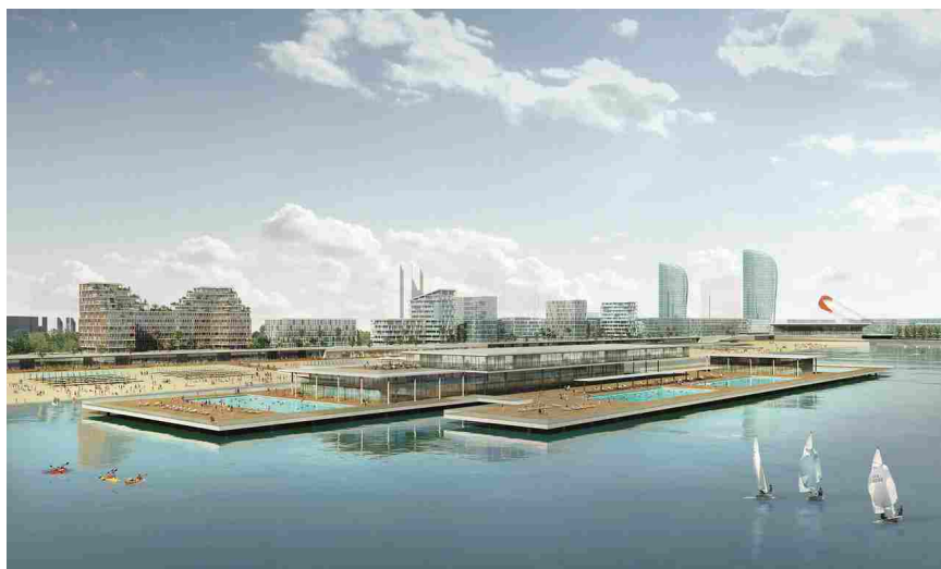
Il progetto di GALA China per la Marina di Jinshan a Shanghai

Il progetto firmato GALA China, salvaguardando le caratteristiche originarie del luogo, ha permesso l'incontro di mare e città, di stile italiano e tradizione cinese, proponendo un modello urbano alternativo a quello rappresentato dalla serialità di un quartiere dormitorio o dall'esibizionismo di una downtown verticale. L'ispirazione seguita è stata quella "orizzontale" in cui si può contemporaneamente vivere, lavorare, divertirsi, apprendere; un modello nel quale natura e architettura creano una nuova armonia, fatta di tante occasioni di socialità e incontro. Il progetto "La Dolce Vita", infatti, pone in relazione, secondo una sapienza tutta italiana, natura e urbanità.