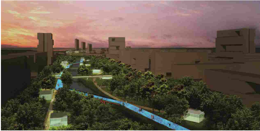
Il progetto di GALA China per la Marina di Jinshan a Shanghai

Il progetto del landscape considera gli spazi aperti come una infrastruttura verde, un parco lineare che connette i vari ambiti del progetto e si declina in diversi paesaggi. All'interno del parco lineare è previsto il sistema diffuso dei musei : spazi per l'apprendimento al cui interno è possibile sperimentare un percorso formativo legato alle tematiche ambientali, alla cultura, all'arte e alla tradizione locale.